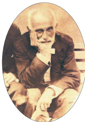
Francisco Giner de los Ríos.

En efecto, difícil acomodo entre estas Españas, podía tener un personaje de la talla de Juan Ramón Jiménez que, desde 1936 había publicado más sobre guerra y paz, derechos y deberes, que sobre poesía. Para Juan Ramón, soledad poética y sociedad política se volvieron entonces vasos comunicantes de sí mismo, y como hijo de su tiempo y como conciencia libre e insobornable, reiterará su posi-