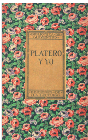
Cubierta de Platero y yo , de Juan Ramón Jiménez (1914).

De Platero y yo se ha dicho que es una elegía andaluza, una autobiografía lírica, un monumento de amor del poeta por su pueblo, al que inmortalizó e hizo universal con él. El caso es que ciertamente se escribió en el periodo más largo que el poeta pasó en su pueblo ya entrado el siglo XX. Cuando Juan Ramón volvió a Moguer a finales de 1905 procedente de Madrid, afectado de una fuerte depresión que agravó la situación económica familiar, prácticamente en la ruina tras la muerte de su padre en el otoño de 1900. En efecto, la extensión de la plaga de la filoxera sobre las viñas moguerenas a partir de 1894 hundirá la viticultura local provocando un profundo estancamiento en el pueblo, a lo que hay que unir el cegamiento del río Tinto por la colmatación de sus depósitos erosivos; todo ello terminará por ahogar la economía moguerena de la primera mitad del