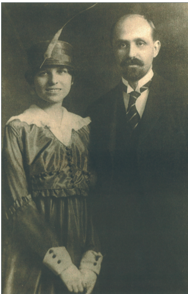
Zenobia Camprubí y Juan Ramón Jiménez (1916).