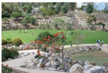
Fig. 1. Rampas y espacio con césped en el Parque.

Los espacios públicos son el lugar material – de forma habitual a escala urbana – donde se producen las interacciones sociales y las actividades pertenecientes al ámbito de “lo público” (Smith y Low 2006). El interés en ellos ha sido creciente desde los años 1990 (Mitchell 2017), coincidiendo con la expansión de las políticas neoliberales a lugares más variados y a más esferas de la vida. Buena parte de la vida de las personas acontece en los espacios públicos, y en el marco de las actuales políticas urbanas estos interesan como arena donde se manifiesta la lucha por el poder, y que son tratados como productos a mercantilizar y controlar (ibid). Desde una visión crítica es relevante conocer las prácticas específicas que producen estos lugares y limitan su accesibilidad (Stachel y Mitchell 2008).