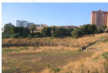
Fig. 2. Parque durante una de las múltiples reformas.